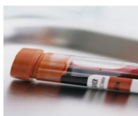
22 analize de Biochimie

În cadrul societății noastre puteți efectua peste 2000 de teste medicale de laborator. Acestui pachet se pot adăuga orice altă analiză pentru a completa solicitările dumneavoastră.